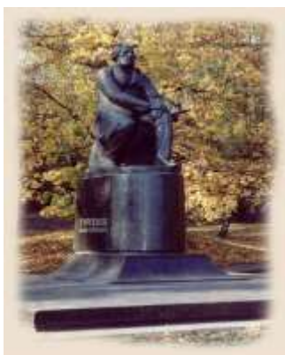
Памятник Тургеневу И.С.

Этот сборник стал прощанием Тургенева с жизнью и искусством.